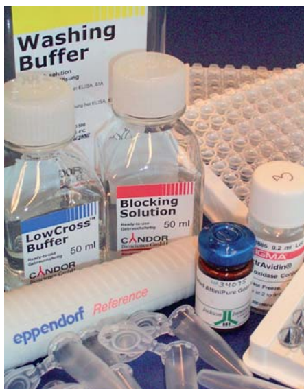
▲ Abb. 1: Fertigwaren für ELISAs gibt es in großer Auswahl.